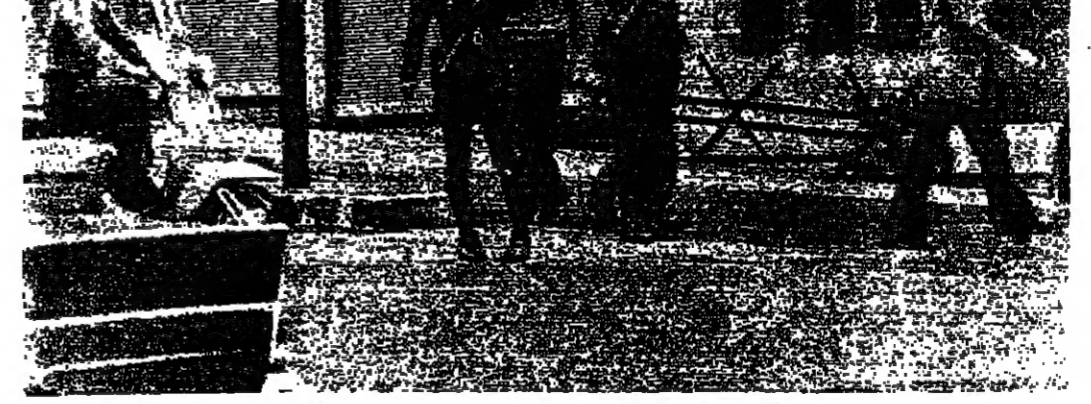
.. وعاد رجال شرطة السير الى الاسواق

في شوارع بيروت وضواحيها وان الهدوء قائم على هذه المناطق. وعلى صعيد السير، كانت الحركة في ساعات الصباح ناشطة حيث انتقل عدد كبير من المواطنين الى مراكزهم، الا ان الشوارع لم تشهد حركة ازحاما، كما شهدتها في الأيام العادية.